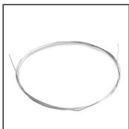
NEREZOVÝ DRÁT FI-1 C24510N00