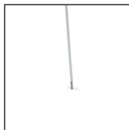
PRUT PUSZ-ALU C28272A, C28272A07