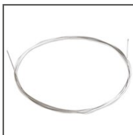
LANKO CU FI 0,95 mm Z70240